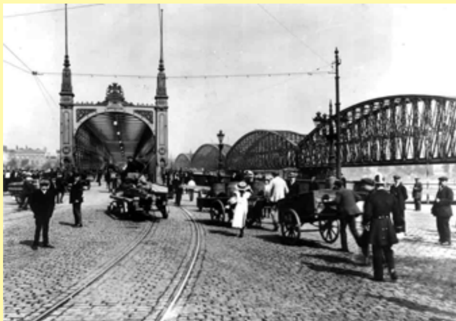
De spoorbrug vormde een ideale verbinding tussen de overvolle bebouwde kom ten noorden van de Maas en de nieuwbouw op de zuidelijke Maasoever.