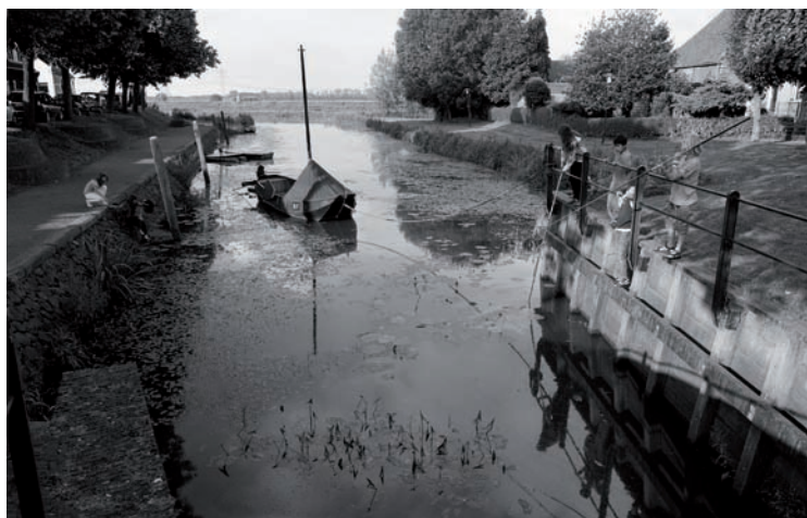
Hooge Zwaluwe - Haven (Fotografie: Joop Reijngoud, 2009).

Veel waterschappen hebben een hoge leeftijd en een overzichtelijke archief, dat zich al sinds mensenheugenis op één plek bevindt en beheerd wordt door waterschapsarchivariissen. Die zijn vaak heel goed op de hoogte van de waterstaatsgeschiedenis in hun werkgebied en waren ook dikwijls in de gelegenheid om daar een bijdrage aan te leveren. De hoge leeftijd van die waterschappen staat meer dan eens borg voor een rijke oogst aan historische studies.