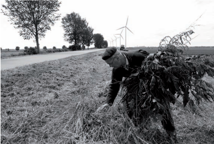
Stampersgat - Polder Kaas en Brood (Fotografie: Joop Reijngoud, 2009).

de kans dat de informatie ook zonder poldernaam vindbaar is. Je kunt dan volstaan met het aanwijzen van het gebied waar je meer over wil weten. Dankzij zo'n cartografische ontsluiting krijg je meteen een goed idee van de omvang van de polders en hun ligging ten opzichte van het water en de aangrenzende polders.