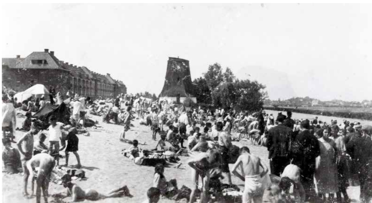
Badplaats Reserveboezem (collectie Stadsarchief Rotterdam ca 1905).