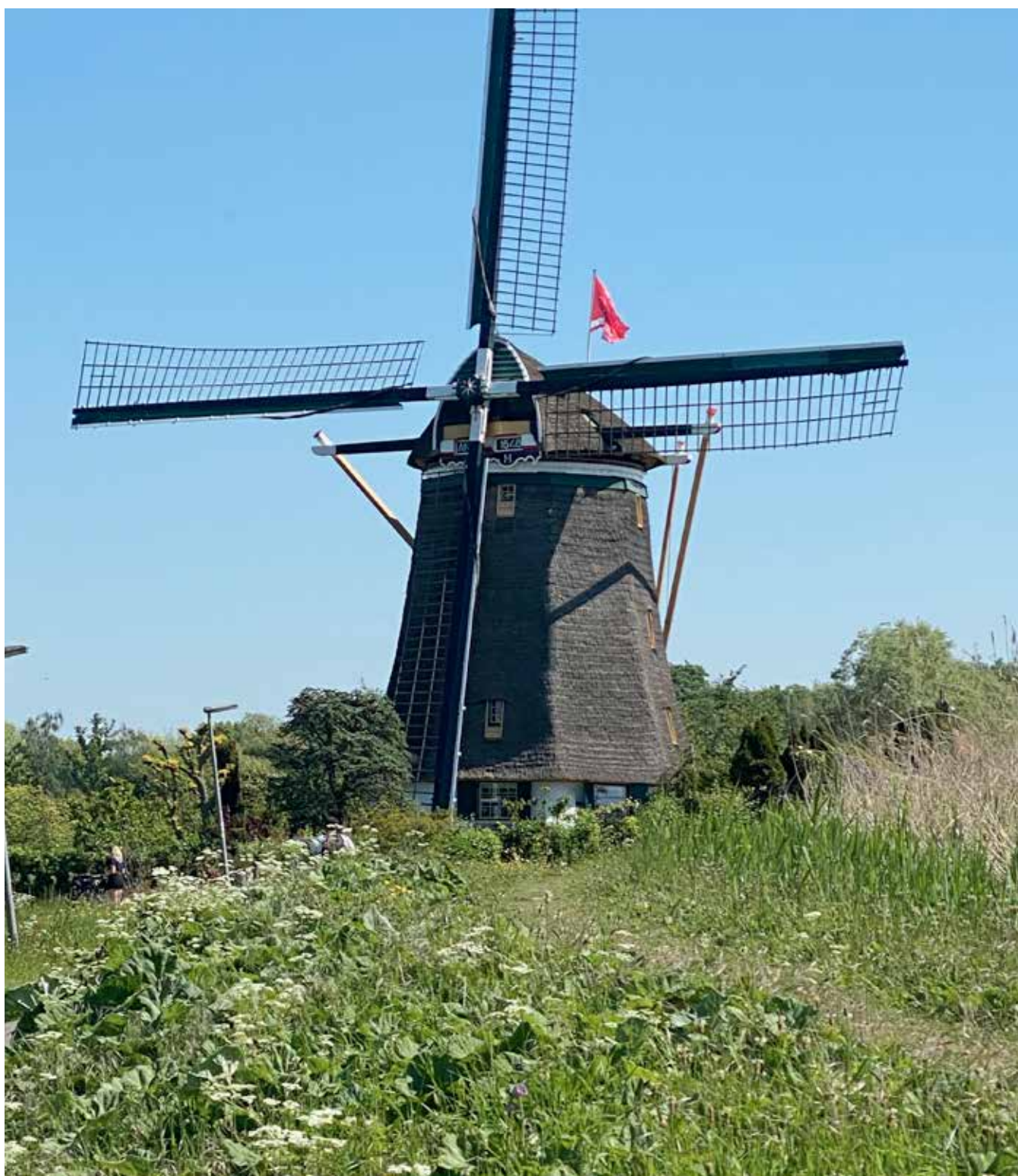
De Prinsenmolen in Hilligersberg, gebouwd in 1648